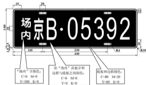
图 H 场(厂)内专用机动车辆车牌样式

(4)字间隔，车牌类别名称(“场内”)与省、自治区、直辖市代号之间为 16mm，“场内”两字间隔 10mm，设区的市代号、点(“·”直径 10mm)、顺序号之间均为 12mm。 车牌颜色、有关尺寸按照图 H 标注。